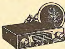
NE 536 V 4.426,40 PTS.