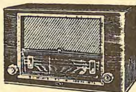
BE 541 A 3.894,25 PTS.