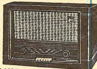
BE 652 A 3.894,25 PTS.