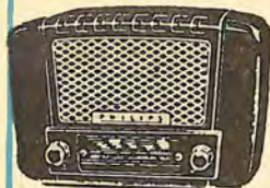
BE 352 U 1.947,15 PTS