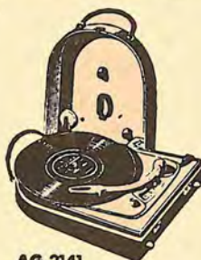
AG 2141 1.526,15 PTS.