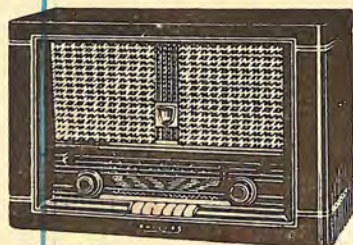
BE 752 A 5.894,00 PTS