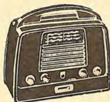
LE 443 UB 2.973,35 PTS