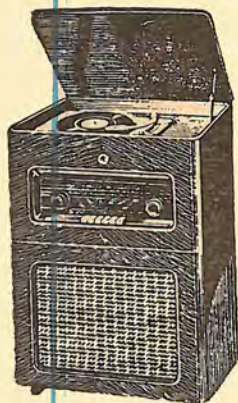
FE 651 A 8.420,00 PTS.